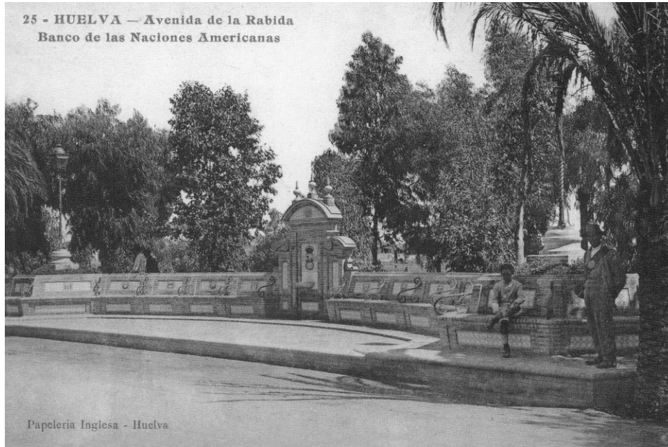
Figura 1. Original Fuente de las Naciones

La Fuente de las Naciones se inaugura en el verano de 1917, destacando en su arquitectura asientos de ladrillo visto y azulejos, decoraciones de cerámica artesonados, hierro forjado y repujado, mármol labrado, y como broche final, los escudos de las Naciones Iberoamericanas en cada uno de sus asientos, dotando de ambiente renacentista con aire neomodéjar una joya arquitectónica.