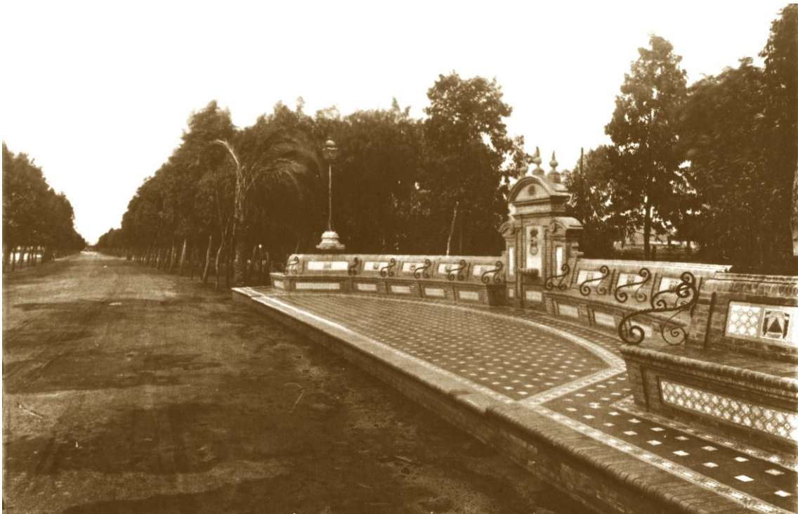
Figura 3. Imagen histórica de la Fuente de las Naciones

El alcance del trabajo que deberá realizar el adjudicatario consiste en la redacción del Proyecto para la construcción de una recreación de la Fuente de las Naciones.