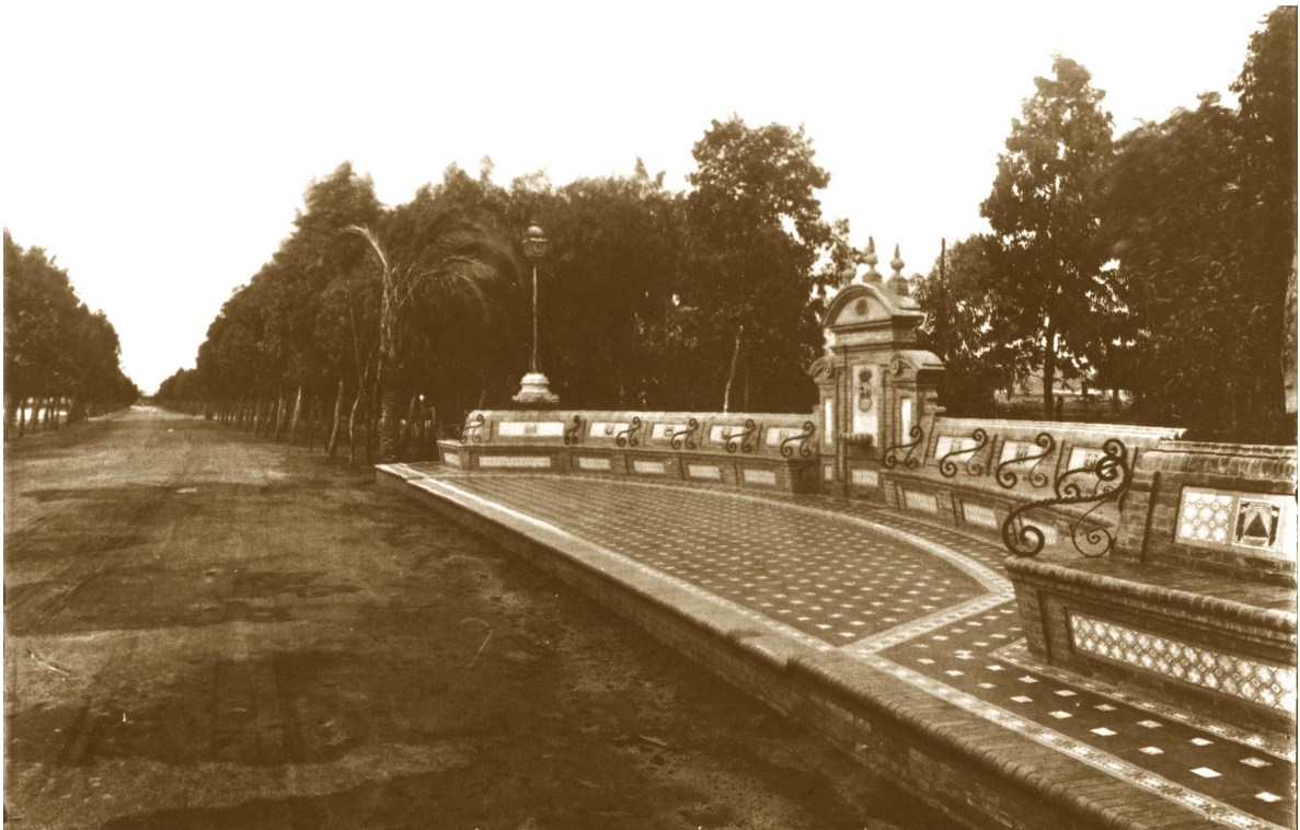
Figura 1. Original Fuente de las Naciones, formada por estructura central presidida por una fuente al estilo pila bautismal, semiarco como coronación y balastradas como remate en la coronación. Las dos estructuras laterales la forman un conjunto de bancos diferenciados por detalles de hierro forjado y martillado. Como detalles decorativos, ladrillo visto y cerámica labrada a modo cenefa.