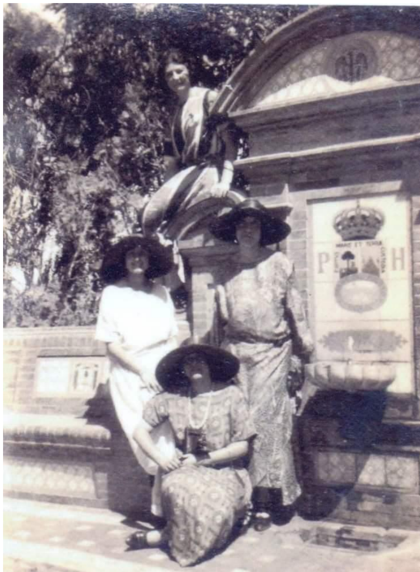
Figura 2. Detalle mediante retablo cerámico de escudo original Puerto de Huelva y mujeres Onubenses presidiendo la fotografía junto a fuente de piedra semiesférica, que simula una pila bautismal al estilo bizantino, y formada por equidistantes gallones.